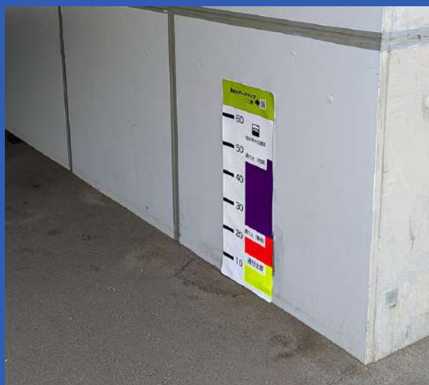
冠水時水位確認ポスト設置イメージ

報道によると、冠水した場所に進入して動けなくなった人々の多くは「水があるけど行けると思った」というコメントをしています。この問題を解決するためには、水深を直感的に伝える表示が有効です。