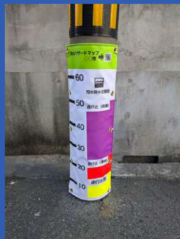
電柱などに巻きつけるタイプ (近日発売予定) お気軽にお問い合わせ下さい