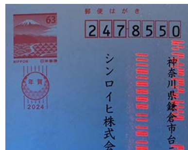
ブラックライト照射時